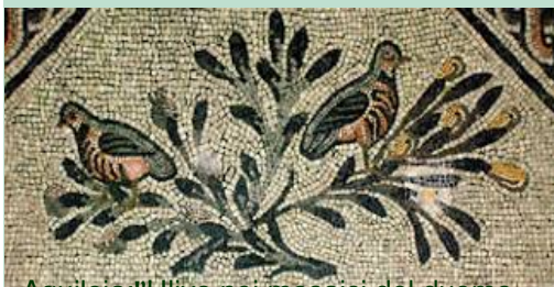
Aquileia: l'Ulivo nei mosaici del duomo

Secondo la Bibbia, fu proprio una colomba, dopo il diluvio universale, a tornare da Noè con un ramoscello d'olivo nel becco. Così l'olivo divenne il simbolo non solo della Rigenerazione della Terra che tornava a nascere, ma anche della Pace che seguiva la fine del castigo per la riconciliazione di Dio con gli uomini.